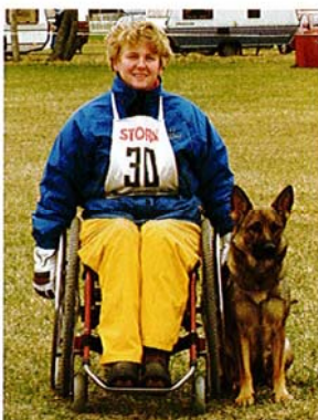
Om viljan finns är ingenting omöjligt!

Köp din valp genom Svenska Schäferhundklubben!! Det tjänar du på, i långa loppet.