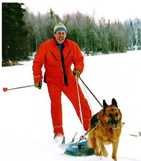
Schäfern – en åretrunhund!

Är du intresserad av schäfer, antingen det gäller bruks-, utställnings-, avelsfrågor eller något annat, då får du ut mer av ditt schäferägande i kretsen av likasinnade – i Svenska Schäferhundklubben – klubben för alla schäfervänner!