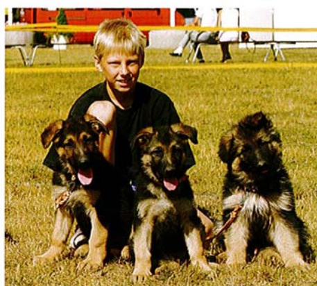
Tre kullsyskon, tre månader gamla.

Men – schäfern tycker om att vara i verksamhet och behöver mycket aktivitet för att bli harmonisk. Därför passar den bara hos familjer som tycker mycket om att vara ute i skog och mark. Och har som målsättning att utbilda sin hund.