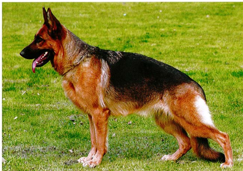
En harmoniskt uppbyggd tik.